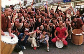
前橋だんべえ踊り