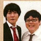
タイムマシーン3号