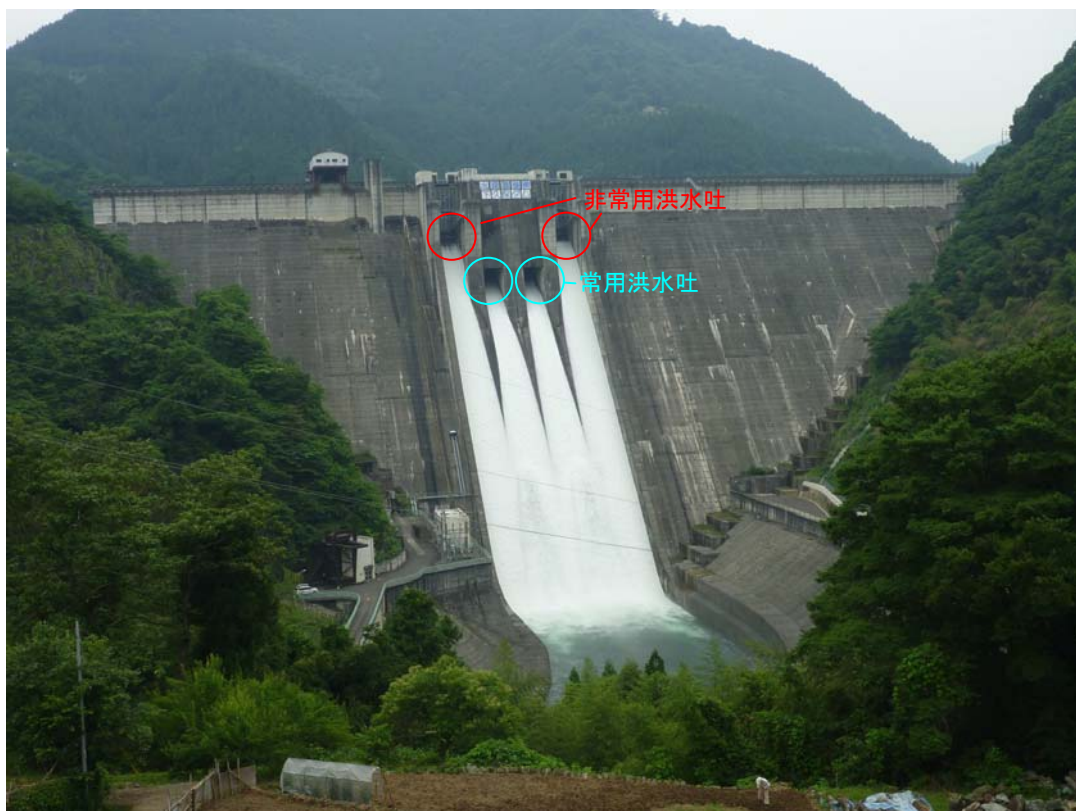
写真：平成 22 年 6 月の点検放流